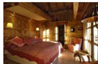
Damit solch hübsche Hütten nicht lange leer stehen, werden sie vermietet oder geteilt

Fehlt nur noch der Privatjet: 20 Flughäfen in den Alpen steuern die Privatjets von Netjets Europe an, darunter den Flughafen Samedan nahe St. Moritz, Innsbruck, Salzburg, Genf und Annecy. Man muss nur einen Anteil an einem Privatjet kaufen und sich die Betriebskosten teilen – ab circa 50 000 Euro ist man dabei. • www.netjetseurope.com